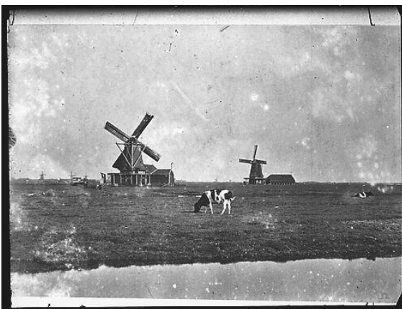
Dit is het Oostzijderveld met links molen de Woudaap en rechts molen het Honingvat, 1915. De laatste molen stond ter hoogte van de Brusselsestraat.

De molen de Rosmolen waar de buurt uiteindelijk haar naam aan ontleend, stond aan de overkant van de Gouw op 100 meter van het Honingvat.